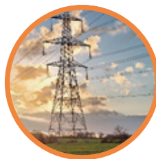
Inspections des biens